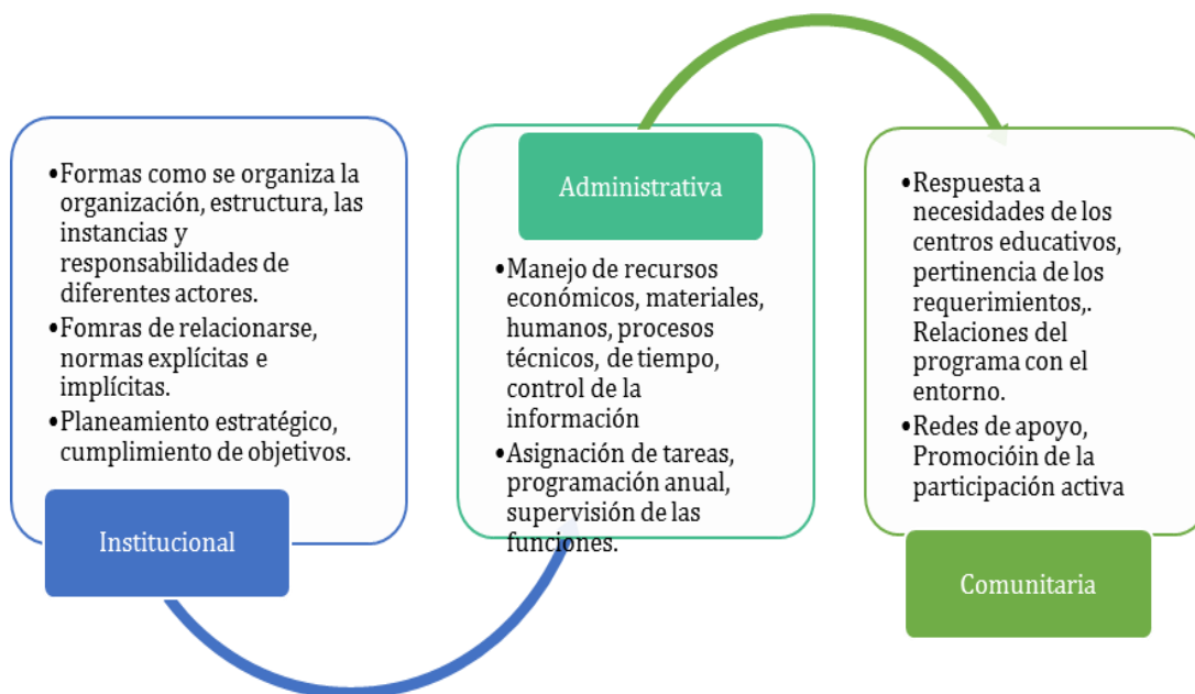
Ilustración No.3 Dimensiones de la gestión educativa: