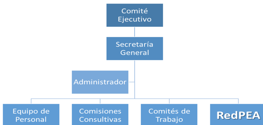
Ilustración No 1. Organigrama de la Comisión Costarricense de Cooperación con la UNESCO